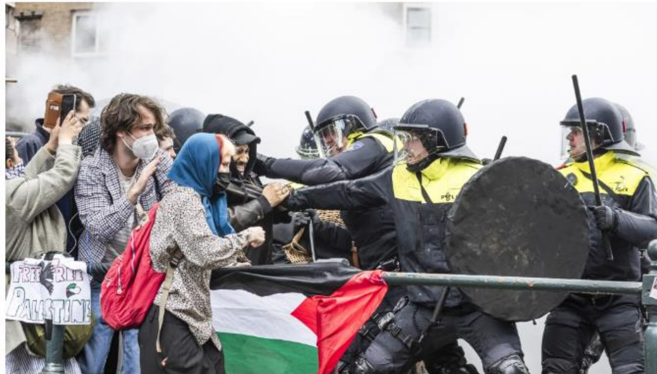
Sammenstøt mellom politi og studenter som demonstrerer ved University of Amsterdam.

I hele Europa mobiliserer studenter mot krigen i Gaza og krever at universitetene deres bryter bånd med Israel.